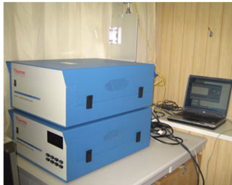
Figure 2 Facility for monitoring atmospheric sulfate particles placed in Fukuejima

春季における九州の大気環境は、大陸からの気塊の影響を強く受ける。長距離にわたる黄砂、大気汚染物質、微生物の移動を把握する目的で、熊本および長崎 (福江島) において大気エアロゾルのサンプリング、モニタリングを行っている (Figure 2)。