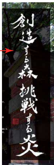
コミュニケーションワード 出版物への使用例②